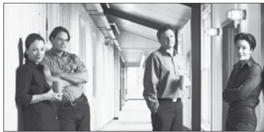
Design von studio 7.5

Zusammen mit einem passenden Hocker bildet der mood Sessel eine leichte, aber durch die elastische Membranbespannung außerordentlich komfortable Entspannungsmöglichkeit.