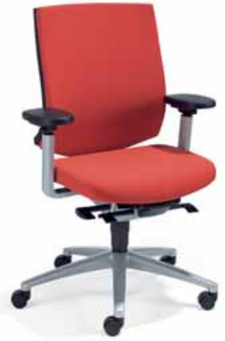
Klöber veo97 Synchron-Drehstuhl. Kunststoffschale mit Polster. MF-Armsupports alu-farbig. Alu-Fußkreuz alu-farbig. Klöber veo97 synchro swivel chair. Polypropylene shell with upholstery. Aluminium-coloured MF Arm Supports. Aluminium-coloured aluminium base.