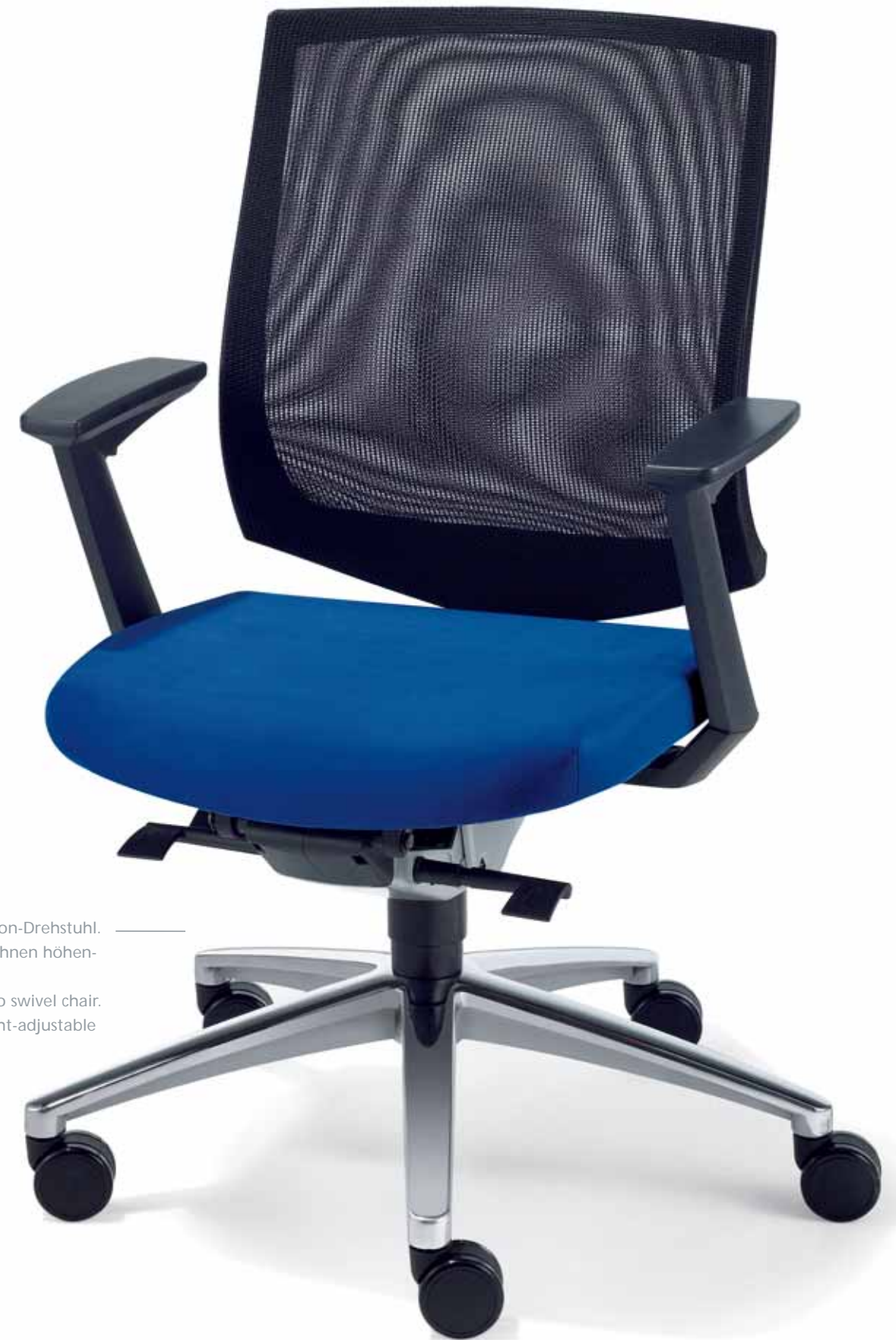
Klöber veo87 Synchron-Drehstuhl. Netzurücken. Z-Armlehnen höhenverstellbar. Klöber veo87 synchro swivel chair. Mesh backrest. Height-adjustable Z-armrests.