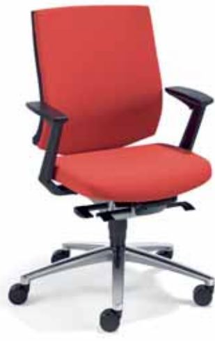
Klöber veo97 Synchron-Drehstuhl. Kunststoffschale mit Polster. Z-Armlehnen. Alu-Fußkreuz poliert. Klöber veo97 synchro swivel chair. Polypropylene shell with upholstery. Z-armrests. Polished aluminium base.