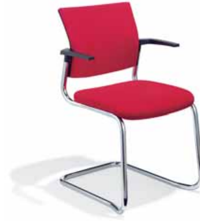
Klöber veo56 Freischwinger. Polster-Rücken. Gestell verchromt. Stapelbar. Armlehnen aus glasfaser-verstärktem Kunststoff. Klöber veo56 cantilever model. Upholstered backrest. Chrome-plated frame. Stackable. Armrests made of fibre-glass-reinforced polyamide.