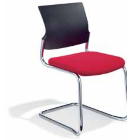
Klöber veo56 Freischwinger. Kunststoff-Rücken. Gestell verchromt. Stapelbar. Ohne Armlehnen. Klöber veo56 cantilever model. Polypropylene backrest. Chrome-plated frame. Stackable. Without armrests.

Armlehnen-Varianten: Z-Armlehnen (3553). 3D-Armsupports (3548), optional zusätzlich mit Lederauflage (3588). 4F-Armsupports schwarz (3557), schwarz mit Lederauflage (3577), alu-farbig (3558), alu-farbig mit Lederauflage (3578), poliert (3559), poliert mit Lederauflage (3579). MF-Armsupports schwarz (3567), alu-farbig (3568), poliert (3569). Ring-Armlehnen (3544). Armrest variants: Z-armrests (3553) 3D Arm Supports (3548), also with leather finish as an option (3588). 4F Arm Supports black (3557), black with leather finish (3577), aluminium-coloured (3558), aluminium-coloured with leather finish (3578), polished (3559), polished with leather finish (3579). MF Arm Supports black (3567), aluminium-coloured (3568), polished (3569). Ring armrests (3544).