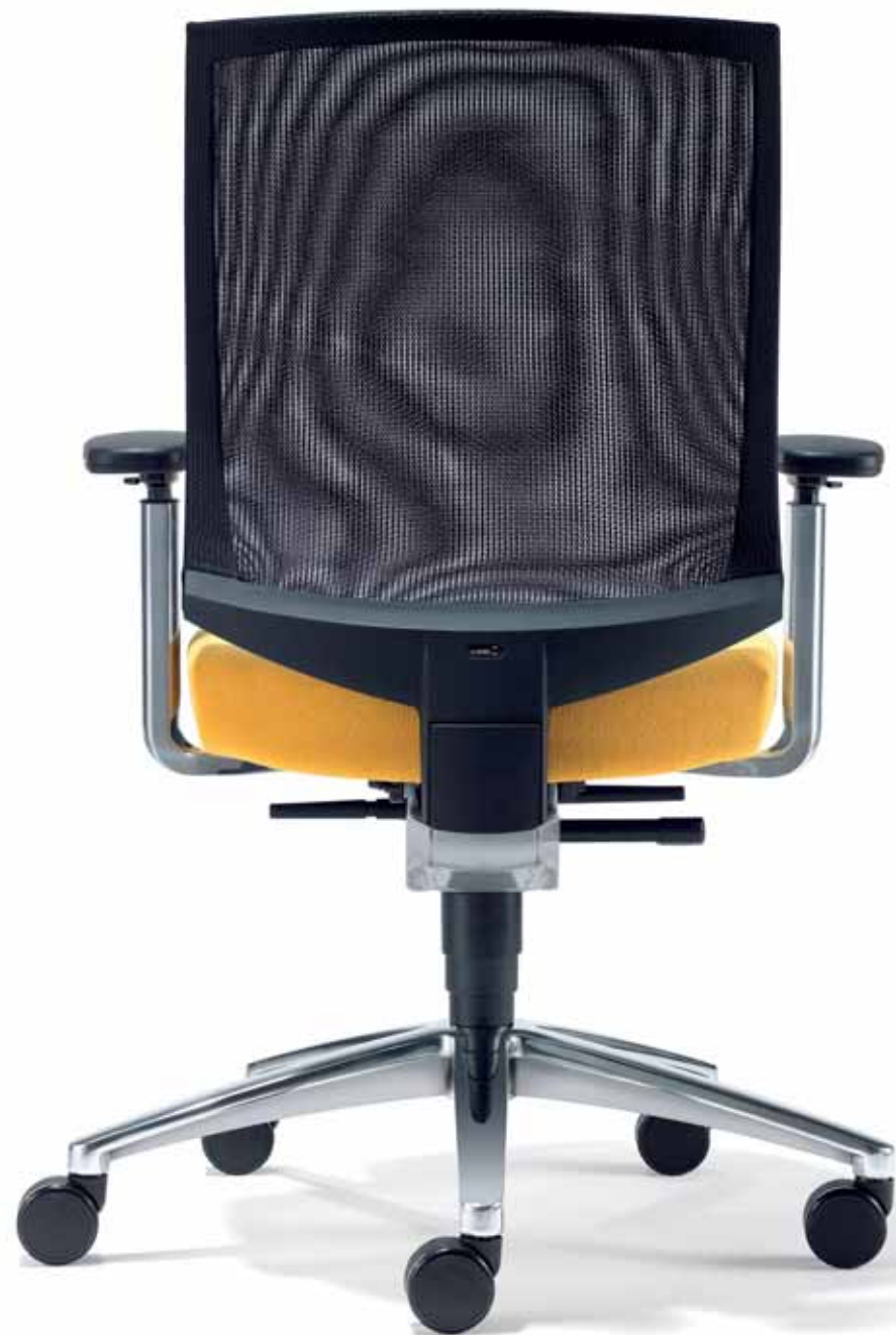
Klöber veo87 Synchron-Drehstuhl. NetZRücken. 4F-Armsupports. Klöber veo87 synchro swivel chair. Mesh backrest. 4F Arm Supports.

Klöber Veo mit NetZRücken. Die elastische Rückenlehne mit doppel-lagigem, gestricktem Netz schmiegt sich perfekt an die Form des menschlichen Rückens an und stützt die Wirbelsäule in jeder Haltung. Der S-Schwung unterstützt zusätzlich die Schulterpartie. Die Rückenlehne lässt sich um 6 cm in der Höhe verstellen und passt sich allen Größen perfekt an.