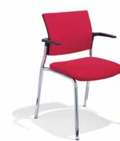
Klöber veo57 Vierbeiner. Polster-Rücken. Gestell verchromt. Stapelbar. Armlehnen aus glasfaserverstärktem Kunststoff Klöber veo57 Klöber veo57 four-legged chair. Upholstered backrest. Chrome-plated frame. Stackable. Armrests made of fibre-glass-reinforced polyamide.