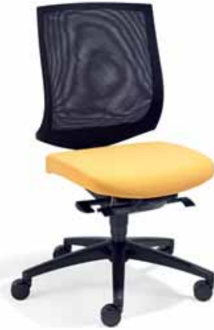
Klöber veo87 Synchron-Drehstuhl. Netzrücken schwarz. Ohne Armlehnen. Kunststoff-Fußkreuz schwarz. Klöber veo87 Klöber veo87 synchro swivel chair. Black mesh backrest. Without armrests. Black polyamide base.