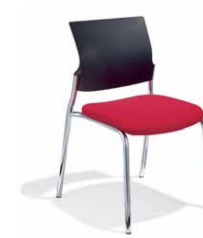
Klöber veo57 Vierbeiner. Kunststoff-Rücken. Gestell verchromt. Stapelbar. Ohne Armlehnen. Klöber veo57 four-legged chair. Polypropylene backrest. Chrome-plated frame. Stackable. Without armrests.