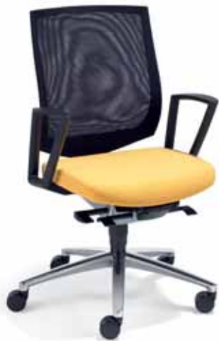
Klöber veo87 Synchron-Drehstuhl. Netzrücken schwarz. Ring-Armlehnen. Alu-Fußkreuz poliert. Klöber veo87 synchro swivel chair. Black mesh backrest. Ring armrests. Polished aluminium base.

Armlehnen-Varianten: Z-Armlehnen (3553). 3D-Armsupports (3548), optional zusätzlich mit Lederauflage (3588). 4F-Armsupports schwarz (3557), schwarz mit Lederauflage (3577), alu-farbig (3558), alu-farbig mit Lederauflage (3578), poliert (3559), poliert mit Lederauflage (3579). MF-Armsupports schwarz (3567), alu-farbig (3568), poliert (3569). Ring-Armlehnen (3544). Armrest variants: Z-armrests (3553) 3D Arm Supports (3548), also with leather finish as an option (3588). 4F Arm Supports black (3557), black with leather finish (3577), aluminium-coloured (3558), aluminium-coloured with leather finish (3578), polished (3559), polished with leather finish (3579). MF Arm Supports black (3567), aluminium-coloured (3568), polished (3569). Ring armrests (3544).