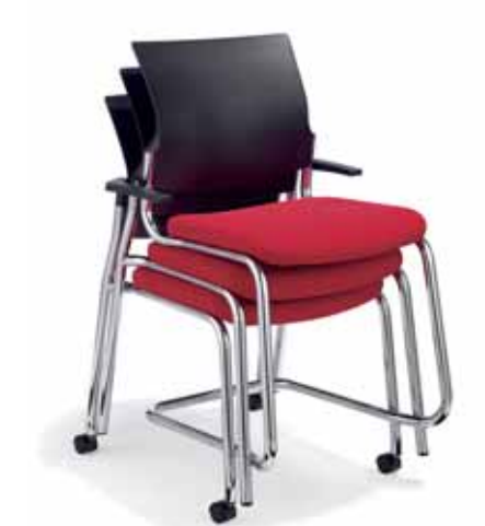
Klöber veo56/veo57 Stapel bestehend aus Vierbeiner mit schwenkbaren Rollen, Freischwinger und Vierbeiner. Gestell verchromt. Klöber veo56/veo57 Stack consists of four-legged chair with swivel castors, cantilever model and four-legged chair. Chrome-plated frame.