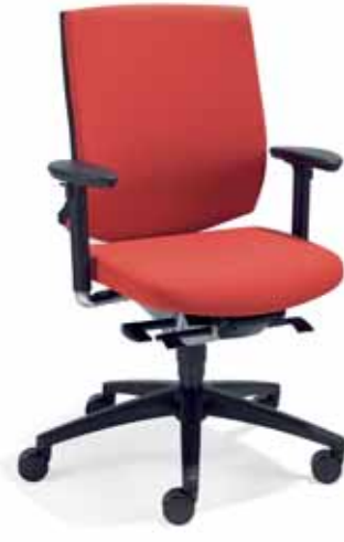
Klöber veo97 Synchron-Drehstuhl. Kunststoffschale mit Polster. 3D-Armsupports. Kunststoff-Fußkreuz schwarz. Klöber veo97 synchro swivel chair. Polypropylene shell with upholstery. 3D Arm Supports. Black polyamide base.